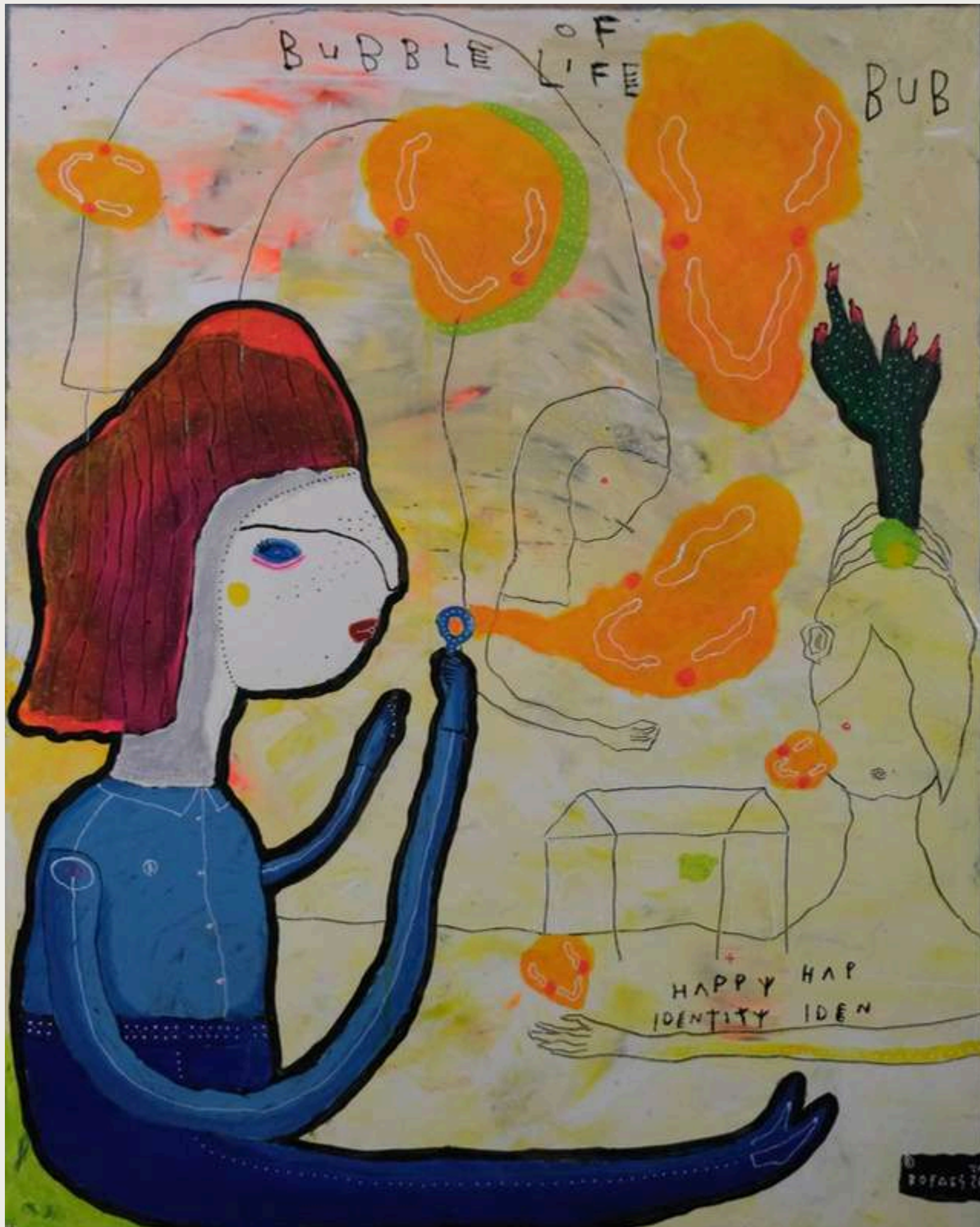
"Bubble for all conquerers"