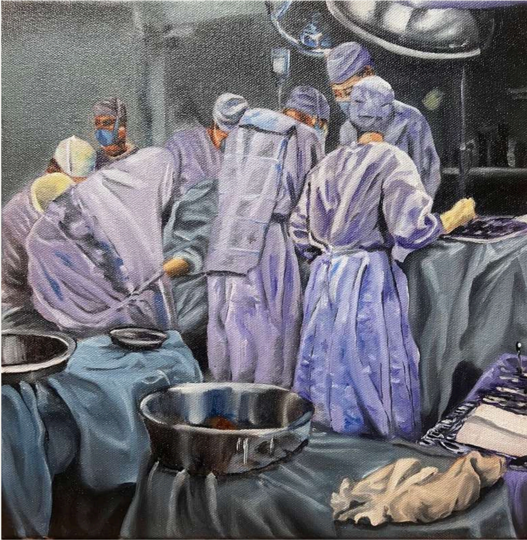
"When something bad happens"